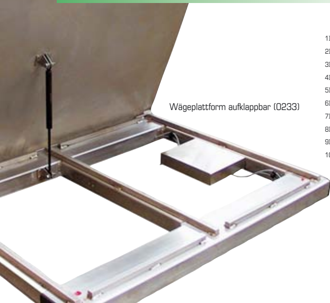
Wägeplattform aufklappbar (0233)