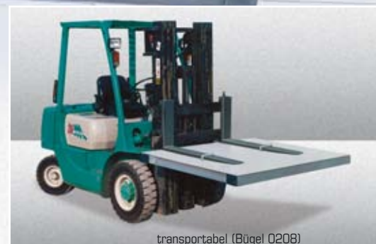
transportabel (Bügel 0208)