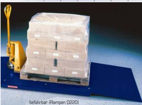
befahrbar (Rampen 0220)