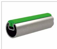
Rohrprofil mit Kunststoffeinlage Typ 016-2