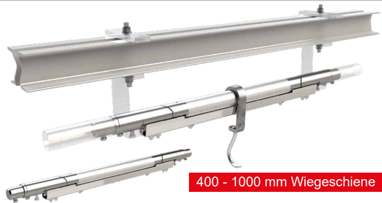
400 - 1000 mm Wiegeschiene