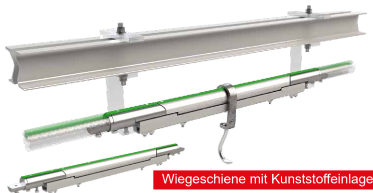
Wiegeschiene mit Kunststoffeinklebung