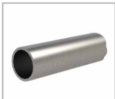
Rohrprofil Ø 60,3 x 4,5 mm

1) unter dem Minimalwert nur für nicht eichpflichtige Wägen. 2) bei gleichmäßig verteilter Last